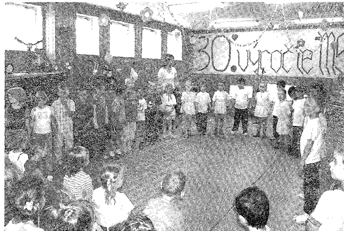
Rozlúčka budúcich prúčikov so svojimi kamarátmi - škôlkármi.